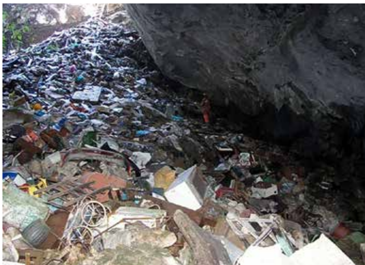
Σπηλαιοβάραθρο Αγ. Άννας Βοιωτίας, πριν και μετά τον καθαρισμό του μετά τη διαμεσολάβηση του ΣτΠ, 2013 – 2017