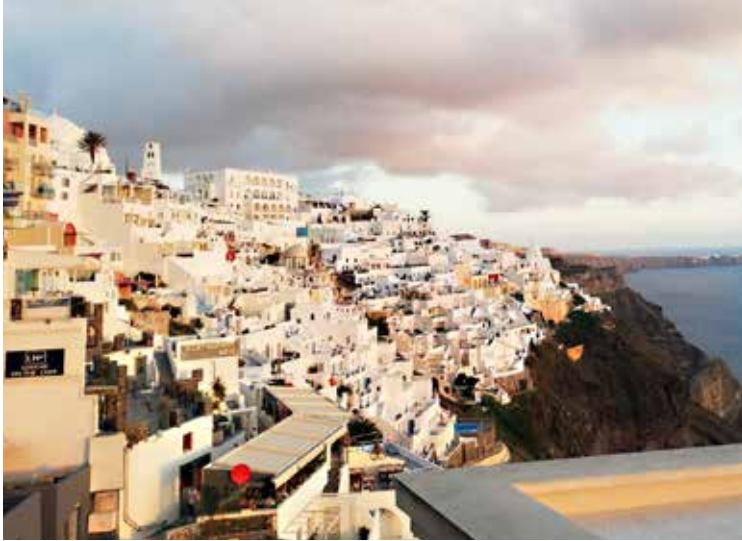
Φηρά Σαντορίνης – 2023