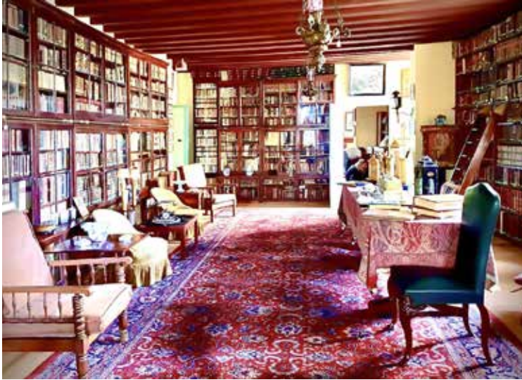
Οικία Ρώμα στη Ζάκυνθο, 2022