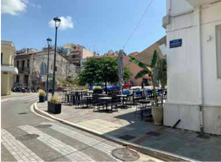
Καφετέρια Άρτα, 2023

Η ηχητική όχληση αποκτά δραματικές διαστάσεις τους θερινούς μήνες στα νησιά. Σε αναφορά για Κ.Υ.Ε. εντός της παλαιάς πόλης της Κέρκυρας 110 καταγγέλθηκε ηχορύπανση και παράνομη κατάληψη κοινόχρηστου χώρου. Μετά την παρέμβαση του Συνηγόρου, οι συναρμόδιες Υπηρεσίες (Εφορεία Αρχαιοτήτων Κέρκυρας και Αστυνομική Διεύθυνση), προχώρησαν στην ανάκληση της προηγούμενης χορηγηθείσας σύμφωνης γνώμης και στην έκδοση εντολής απομάκρυνσης όλων των κινητών στοιχείων από τον κοινόχρηστο χώρο. Οι ενέργειες αυτές οδήγησαν στην αποκατάσταση των αυθαιρεσιών από την επιχείρηση.