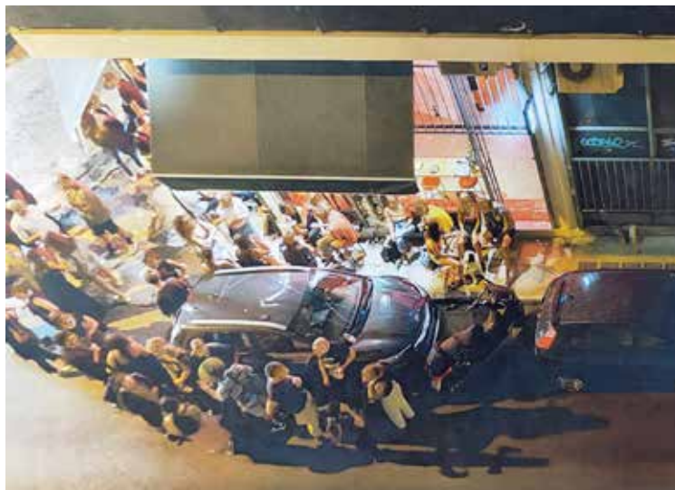
Κατάστημα Υγειονομικού Ενδιαφέροντος Εξάρχεια, 2022

Ως ιδιαίτερα σημαντικό ζήτημα αναδεικνύεται η εγκατάσταση ανταγωνιστικών χρήσεων στο ιστορικό κέντρο. Ιδιοκτήτες ξενοδοχείων/ενοικιαζόμενων δωματίων στην περιοχή του Ψυρρή, στην πλατεία Καρύτση και στην οδό Αθηνάς διαμαρτυρήθηκαν για τη συστηματική ηχορύπανση που προκαλούν Κ.Υ.Ε., εκπέμποντας μουσική με ένταση και διοργανώνοντας μεταμεσονύκτια πάρτι μέχρι πρωίας, με αρνητικές συνέπειες για τις επιχειρήσεις τους 106 .