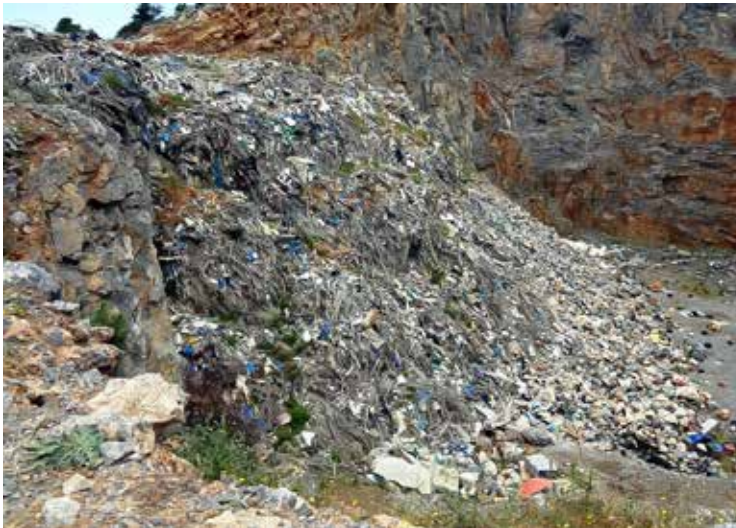
Ρέθυμνο, ΧΑΔΑ, 2017

οποίες η Ελλάδα έχει καταδικαστεί από το Δ.Ε.Ε., εξακολουθεί να γίνεται καύση των αποβλήτων. Κατά τη διαμεσολάβηση του Συνηγόρου, προέκυψε ότι ο Δήμος Καλυμνίων δεν είχε προβεί σε ενέργειες αποκατάστασης του Χ.Α.Δ.Α., καθώς και σε λήψη των απαιτούμενων μέτρων για την αποσόβηση του κινδύνου πυρκαγιάς, κατάρρευσης των πρανών και διαχείρισης των στραγγισμάτων. Αντίστοιχα, στον Δήμο Λέρου, δεν υπάρχουν ακόμα υποδομές επεξεργασίας και τελικής διάθεσης των Α.Σ.Α. Η διάθεση των στερεών αποβλήτων του Δήμου γίνεται στον υφιστάμενο Χ.Α.Δ.Α. στη θέση Τσίγκουνας, για τον οποίο έχει ληφθεί άδεια αποκατάστασης. Τέλος, καταγγέλθηκε η λειτουργία και άλλου Χ.Α.Δ.Α. στον οποίο γινόταν καύση απορριμμάτων, κυρίως κατά τους θερινούς μήνες, στην προστατευόμενη περιοχή Διαπόρι, όπου έχει ιδρυθεί μόνιμο Καταφύγιο Άγριας Ζωής.