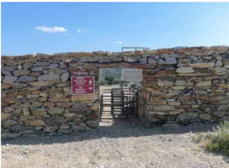
Ίλος, δίοδος προς την παραλία, 2023

Συχνές, επίσης, είναι οι αναφορές πολιτών για την παρεμπόδισή τους να μεταβούν στη θάλασσα λόγω μη εξασφάλισης ελεύθερης διόδου από παρακείμενες επιχειρήσεις ή δυσχέρασης της πρόσβασης 305 . Έχουν καταγγελθεί περιφράξεις, κλειστές πόρτες, μοναδική δυνατότητα πρόσβασης προς την παραλία μέσα από το κατάστημα της επιχείρησης, κ.λπ. Μετά από ενέργειες του Συνηγόρου, υπήρξε καθαίρεση των περιφράξεων 306 είτε με ενέργειες του ίδιου του παραβάτη είτε της οικείας Αποκεντρωμένης Διοίκησης.