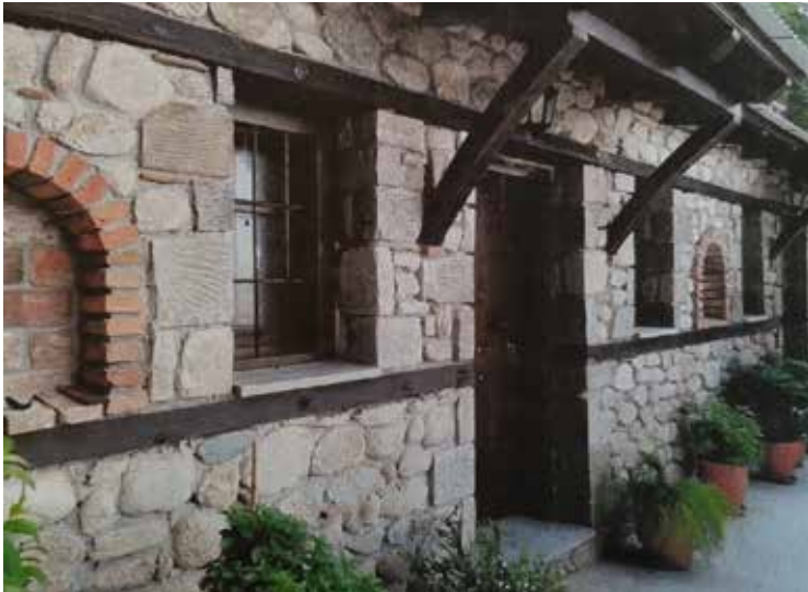
Κτίσμα εντός του αρχαιολογικού χώρου των Μετεώρων χωρίς την έκδοση των απαιτούμενων αδειών, 2017

χαρακτηριστικών των βυζαντινών μνημείων, καθώς οι τελεσθείσες κατασκευαστικές εργασίες δεν είχαν σεβαστεί τα αρχιτεκτονικά χαρακτηριστικά των κτιρίων, ούτε είχαν τηρηθεί τα προβλεπόμενα από το ειδικό πλαίσιο προστασίας. Εντός του 2023 καταγγέλθηκαν νεότερες παρεμβάσεις στην Α' Αρχαιολογική Ζώνη των Μετεώρων, με τοποθέτηση μεταλλικού ικριώματος ύψους περί των 30 μέτρων και διάνοιξη αμαξιτού δρόμου, με εκχέρσωση δασικής έκτασης. Οι παρεμβάσεις αυτές χαρακτηρίστηκαν από την αρμόδια Εφορεία Αρχαιοτήτων ως «προκαταρκτικές ενέργειες» για βελτίωση της πρόσβασης, προκειμένου να διενεργηθούν αρχιτεκτονικές μελέτες σε ερείπια παλαιάς μονής, της οποίας σκοπείται η ανακατασκευή. Η Αρχή επεσήμανε ότι δεν έχει τηρηθεί το προβλεπόμενο πλαίσιο εγκρίσεων, πρωτίστως από το Κ.Α.Σ., αλλά και από τις συναρμόδιες Υπηρεσίες 164 .