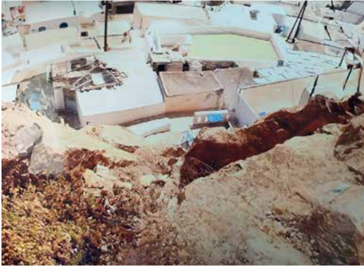
Κάστρο Ανάφης, 2019