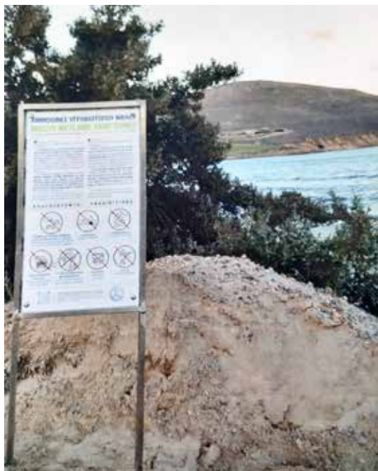
Μώλος Πάρου (προστατευόμενος υδρότοπος), 2023

νισε την υποχρέωση ελέγχου από την αρμόδια υπηρεσία της Περιφέρειας Κεντρικής Μακεδονίας, ζήτησε από το Υ.Π.ΕΝ. την ένταξη της περιοχής σε προστατευτικό πλαίσιο. Αν και υπήρξε θετική ανταπόκριση από το Υ.Π.ΕΝ. ως προς τη δυνατότητα χαρακτηρισμού, αυτό μέχρι σήμερα δεν έχει πραγματοποιηθεί.