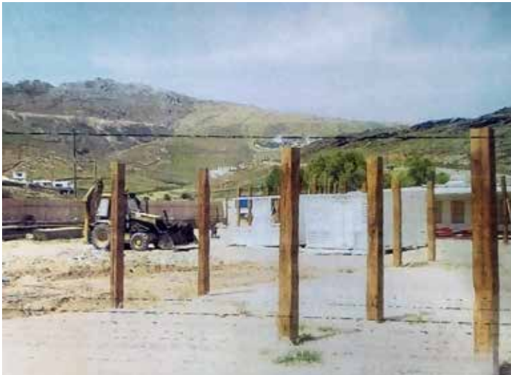
Πάνορμος Μυκόνου, εργασίες δημιουργίας μόνιμης κατασκευής, 2016

φαλλονιάς 287 , χωρίς καμία περιβαλλοντική ή άλλη αδειοδότηση. Η κατασκευή λιμενοβραχίονα εντός της ζώνης αιγιαλού – παραλίας και εντός της θάλασσας προς εξυπηρέτηση του καταφυγίου οδήγησε στην αλλαγή της ροής των κυμάτων, όπως επιβεβαιώθηκε από δύο εκθέσεις του Ελληνικού Κέντρου Θαλασσίων Ερευνών (ΕΛ.ΚΕ.Θ.Ε.) και στην πρόκληση βλάβης σε κτιριακό συγκρότημα (ελαιοτριβεία, παλαιά οικία και εκκλησιάκι). Το εν λόγω συγκρότημα προϋπήρχε (από το 1850) σε μικρή απόσταση από τη θάλασσα εντός ζώνης αιγιαλού – παραλίας και είχε χαρακτηριστεί ως διατηρητέο νεότερο μνημείο. Μετά από παρεμβάσεις της Αρχής, αλλά και των λοιπών υπηρεσιών, ο λιμενοβραχίονας κρίθηκε τελεσίδικα κατεδαφιστέος. Η ανεύρεση εργολάβου για το έργο της κατεδάφισης απέβη άκαρπη. Αναμένεται η συνέχιση της διαδικασίας κατεδάφισης, μετά τη λήξη της αναστολής εκτέλεσης των πρωτοκόλλων κατεδάφισης κατασκευών εντός αιγιαλού – παραλίας.