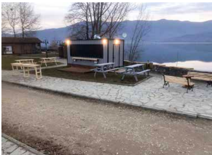
Εγκατάσταση καντίνας στην Κερκίνη, 2023

Στον Συνήγορο καταγγέλθηκε η ξήρανση κέδρων, λόγω άντλησης θαλασσινού ύδατος από τα θεμέλια ανεγειρόμενης οικοδομής και ακόλουθης διοχέτευσής του σε ελώδη έκταση που βρίσκεται εντός περιοχής Natura και περιλαμβάνεται στους προστατευόμενους μικρούς νησιωτικούς υγροτόπους στην Πάρο 248 . Ο Ο.Φ.Υ.Π.Ε.Κ.Α. απέστειλε προτάσεις στον φορέα του έργου, ώστε να διασφαλιστεί η προστασία του υγροτόπου, χωρίς όμως να προβεί στην άσκηση των ελεγκτικών του αρμοδιοτήτων, καθώς δεν έχει εκδοθεί η απαιτούμενη κανονιστική πράξη 249 . Κατόπιν της διαμεσολάβησης του Συνηγόρου, οι οικοδομικές εργασίες διακόπηκαν και αφαιρέθηκε το σύστημα άντλησης/διοχέτευσης των υδάτων.