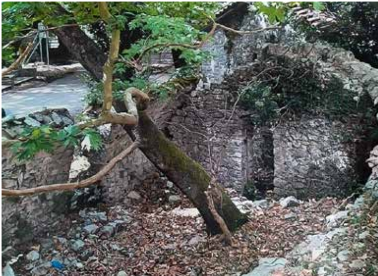
Πλανητέρο Καλαβρύτων, 2017

Η τήρηση της υποχρέωσης οριοθέτησης των ρεμάτων πριν την ανέγερση κτισμάτων υπογραμμίστηκε από την Αρχή σε αναφορά περί της νομιμότητας οικοδομικής άδειας ανέγερσης πέντε κτιρίων εστίασης και αναψυχής, σε ιδιωτική δασική έκταση, στην περιοχή Πλανητέρο 229 Καλαβρύτων, και λίγα έτη αργότερα σε αντίστοιχη αναφορά για την επισκευή και αποκατάσταση παραδοσιακών κτισμάτων, τα οποία θα χρησιμοποιούνταν για σκοπούς αναψυχής των επισκεπτών 230 . Συγκεκριμένα, αναδείχθηκε ότι απαιτείτο οριοθέτηση του ποταμού με την έκδοση Π.Δ., δεδομένου ότι βρίσκεται εντός προστατευόμενης περιοχής, ενώ διαπιστώθηκε ότι υπήρχαν πλημμέλειες στην έκδοση των οικοδομικών αδειών. Τελικά, οι οικοδομικές άδειες ανακλήθηκαν, μεταξύ άλλων και λόγω μη οριοθέτησης του Αροαίου ποταμού.