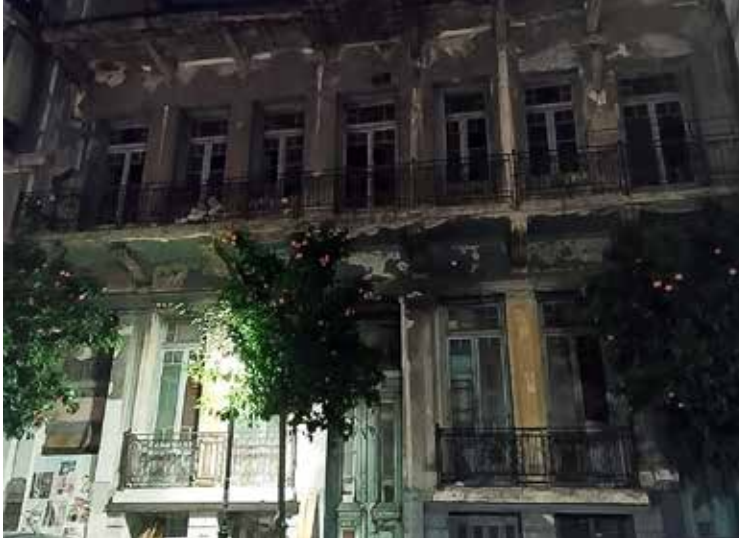
Διατηρητέο ακίνητο στον Πειραιά, 2024

λης συνέβαλε στη διάσωση και ανακαίνιση πολλών κλειστών, επικίνδυνων και ετοιμόρροπων οικοδομών. Ωστόσο, ένα μεγάλο κτιριακό διαθέσιμο εξακολουθεί να αποτελείται από εγκαταλελειμμένα κτίρια, δημιουργώντας στον επισκέπτη της πόλης μία αρνητική εντύπωση. Τα κτίσματα, η συνέχειά τους και η αρχιτεκτονική (κτισμένη) κληρονομιά μιας περιοχής αποτελεί βασικό στοιχείο του πολιτιστικού περιβάλλοντος και πόλο τουριστικής έλξης.