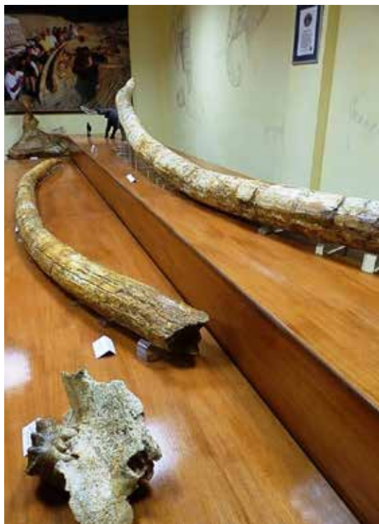
Χαυλιόδοντες από Μαστόδοντα Μηλιάς Γρεβενών και Λατομείο αδρανών υλικών στο οποίο αποκαλύφθηκαν, 2007