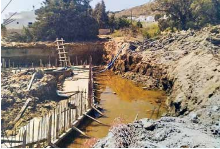
Πάρος – Ξήρανση κέδρων από διοχέτευση θαλασσινού νερού, 2023

στασία τους, στον Οργανισμό Φυσικού Περιβάλλοντος και Κλιματικής Αλλαγής (Ο.Φ.Υ.Π.Ε.Κ.Α.) 246 . Διαπιστώνεται, όμως, ότι οι αρμοδιότητες του Ο.Φ.Υ.Π.Ε.Κ.Α. δεν έχουν γίνει επαρκώς σαφείς στις συναρμόδιες υπηρεσίες που τον θεωρούν αποκλειστικά αρμόδιο όργανο, με αποτέλεσμα να υφίστανται καθυστερήσεις στη διαδικασία ολοκλήρωσης των περιβαλλοντικών επιθεωρήσεων 247 .