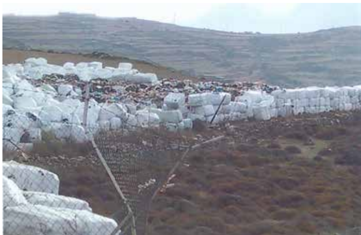
Τήνος, δεματοποιητής αποβλήτων, 2017