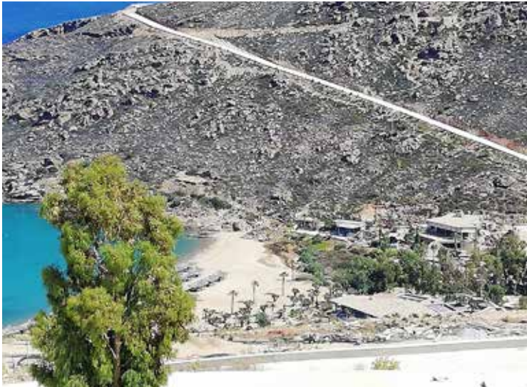
Ίλος, διάνοιξη δρόμου εντός ιδιωτικής έκτασης, 2023

ριστικές εγκαταστάσεις που υλοποιούνται μέσω στρατηγικών επενδύσεων. Ο Συνήγορος είχε εκφράσει την αντίθεσή του με τις εν λόγω προβλέψεις, καθώς με τον τρόπο αυτό ανοίγει ο δρόμος για στρατηγικές επενδύσεις σε παρθένες περιοχές χωρίς υφιστάμενο οδικό δίκτυο ή πρόσβαση σε κοινόχρηστη οδό 448 . Αξίζει, δε, να σημειωθεί ότι οι παρόδιοι ιδιοκτήτες στις οδούς που θα δημιουργηθούν με αυτόν τον τρόπο, στερούνται της δυνατότητας οικοδομησιμότητας των ακινήτων τους.