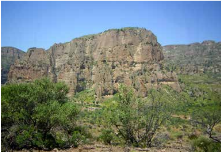
Μπουφούσκια Αιγίου, 2012

Γεωλογικοί ψαμμιτικοί σχηματισμοί υπάρχουν και στην περιοχή Μπουφούσκια Αιγίου 215 , η οποία είναι χαρακτηρισμένη ως Τοπίο Ιδιαίτερου Φυσικού Κάλλους. Στην περιοχή διαπιστώθηκαν εργασίες επιφανειακής απόληψης αδρανών υλικών και δημιουργία υπογείου δανειοθαλάμου, πλησίον των σχηματισμών. Μετά την παρέμβαση της Αρχής, διακόπηκαν οι εργασίες και η περιοχή κηρύχθηκε αναδασωτέα.