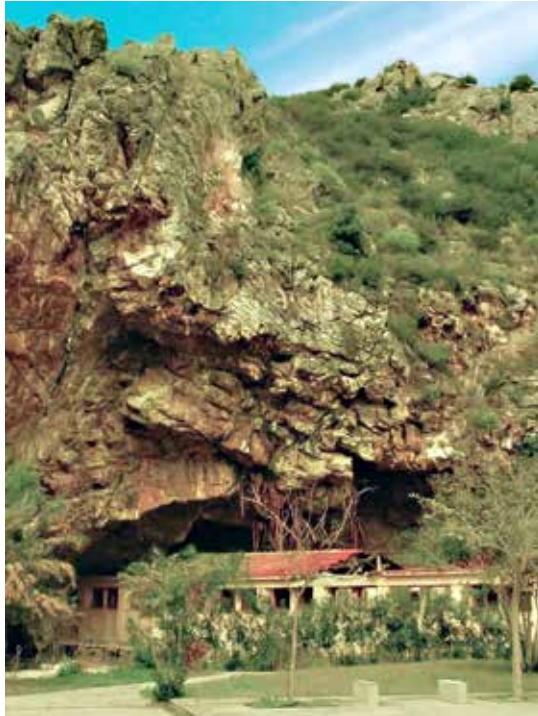
Ιαματικά Λουτρά Καϊάφα, Ετοιμόρροπο κτίσμα λουτρών στην είσοδο του ιαματικού/αρχαιολογικού σπηλαίου/ Οροφή σπηλαίου με διαβρωμένα υποστυλώματα, 2016