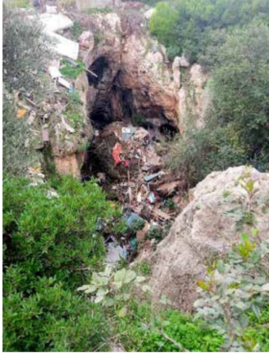
Σπηλαιοβάραθρο Αγ. Ιωάννη Μονεμβασιά, φωτογραφίες φακέλου 2024

καθεστώς προστασίας με τα παλαιοντολογικά ευρήματα, στις περισσότερες περιπτώσεις ενεργοποιείται μόνο η αρχαιολογική νομοθεσία. Στην περίπτωση του σπηλαίου της Αλιστράτης Σερρών 207 , καταγγέλθηκε η κατασκευή ανελκυστήρα και η υλοποίηση έργων κατά την τουριστική αξιοποίησή του, τα οποία αφενός δεν είχαν τις απαιτούμενες άδειες, και αφετέρου προξένησαν βλάβες στο σπήλαιο και στο ευαίσθητο μικροκλίμα/οικοσύστημα αυτού. Η Αρχή έκρινε ότι απαιτείτο η διενέργεια αυτοψίας από αρμόδιους επιστήμονες του ΥΠ.ΠΟ. για την αποτίμηση των ζημιών, και πρότεινε την εκπόνηση ολοκληρωμένης μελέτης για την αποξήλωση του ανελκυστήρα, αλλά και νέα μελέτη ηλεκτροφωτισμού, για να αποφευχθούν ζητήματα ανάπτυξης χλωρίδας στις σπηλαιοαποθέσεις.