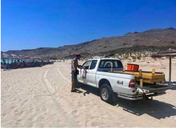
Ελαφόνησος, παραλία Σίμου, 2023