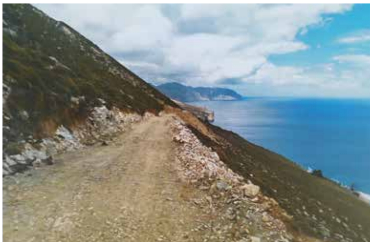
Αμοργός, Παράνομη διάνοιξη δρόμων, 2022

Η βελτίωση και ο εκσυγχρονισμός του οδικού δικτύου αποτελεί αναγκαία προϋπόθεση, όχι μόνο για την ασφάλεια των κατοίκων, αλλά και για την τουριστική ανάπτυξη. Η διάνοιξη οδών έχει ακολουθήσει μοιραία τη μακροχρόνια έλλειψη χωροταξικού σχεδιασμού, τη δυνατότητα της εκτός σχεδίου δόμησης, την έλλειψη σαφούς νομοθετικού πλαισίου, καθώς και την πολυετή ανοχή των αυθαίρετων κτισμάτων και των παράνομων επεκτάσεων οικισμών. Ως εκ τούτου, δεν υφίσταται ένα επαρκές και οργανωμένο – συνεκτικό οδικό δίκτυο, ενώ είναι αμφίβολη, σε πολλές περιπτώσεις, ακόμα και η νομιμότητα αυτού.