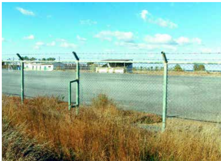
Αποσελέμης, αυθαίρετο γήπεδο ποδοσφαίρου, 2016

ων 271 . Ο νόμος ορίζει 272 ότι, τόσο η ζώνη παραλίας όσο και η χερσαία ζώνη λιμένα, οφείλουν να σταματούν στην ισχύουσα ρυμοτομική γραμμή. Ο αιγιαλός που καθορίζεται βάσει γεωμορφολογικών κριτηρίων που δεν είναι δεκτικά μεταβολής, αν κριθεί ότι εισέρχεται σε σχέδιο πόλης, συνεπάγεται την αναγκαιότητα τροποποίησης του σχεδίου. Τροποποίηση του σχεδίου πόλης προκρίνεται, ομοίως, όταν κριθεί ότι επιβάλλεται επέκταση της χερσαίας ζώνης λιμένα 273 .