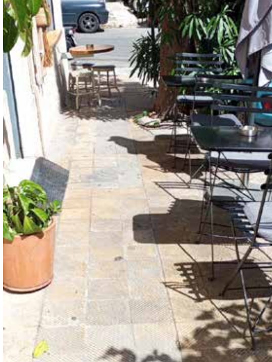
Πεζοδρόμιο στο Κουκάκι, 2024

κού 87 και Γκάζι 88 ) οδηγεί στη σταδιακή υποβάθμιση και στην αλλοίωση της φυσιολογικής τους 89, 90 .