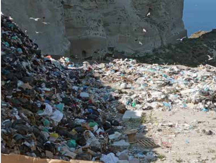
Φηρά Σαντορίνης, ΧΑΔΑ, 2023